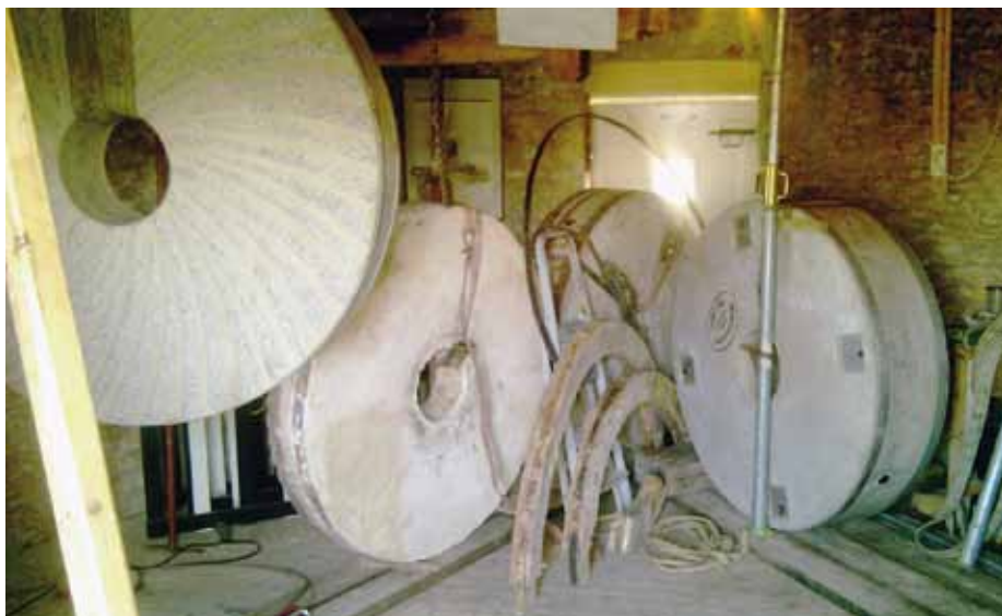
▲ Stenenparade in De Hoop in Rozenburg (foto W. Herrewijnen, 16 januari 2012).

Op molen Aeolus in Vlaardingen hebben we de afgelopen weken het Engels kruierwerk vernieuwd waarbij gelijk een waterpas kruivloer is aangebracht op de betonnen bovenkant van het metselwerk, en zijn de vulstukken van de bovenas vernieuwd, dit was hard nodig omdat twee exemplaren door de boktor zover waren weggevreten dat ze in tweeën lagen het was niet ondenkbaar dat bij het vangen het bovenwiel bleef stilstaan terwijl de as zou doordraaien. Van de grondzeiler in Stad aan het