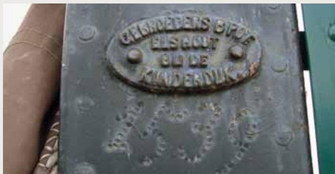
Buiten roede, geklonken. 20.70 meter. Bouwjaar 1888.

▲ Fabricageplaatje van Potroe no. 1539 uit 1888 in de molen van Rockanje. Deze houdt het dus aanmerkelijk langer uit dan zijn confrater uit 1944 (foto Ad Boutkam, 15 april 2009).