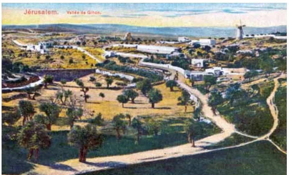
▲De Gihonvallei in Jeruzalem met de molen van Montefiore omstreeks 1900 op een oude Ansichtkaart. De omgeving is sindsdien ingrijpend gewijzigd!

kope wijze van meel te voorzien. De molen bevatte twee paar molenstenen en had een kap met een windroos. De wieken hadden zelfzwaarting. In 1948 is de top van de molen door de Engelsen opgeblazen, omdat de molen door de Joodse ondergrondse als militaire post werd gebruikt bij de verdediging van de Jeruzalem. Sinds die tijd is de molen niet meer in gebruik. Diverse ondernemers in Nederland, maar ook de gemeente Jeruzalem en andere organisaties schaalden zich achter het idee. Het benodigde bedrag kwam binnen en zo konden de te reconstrueren onderdelen in de afgelopen maanden worden gemaakt bij het bedrijf van Bertus Dijkstra in Sloten. Het is de bedoeling dat Dijkstra dit voorjaar met zijn vrouw en drie schoolgaande kinderen voor een periode van drie maanden naar Israël gaat om de restauratie van de molen te begeleiden.