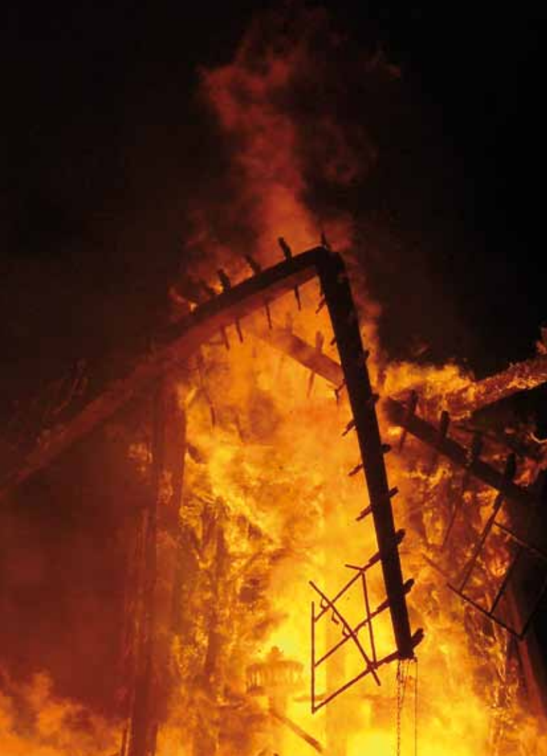
▲ Een spil, kort voor de val (foto Marco Hiemstra, 23.01 uur).