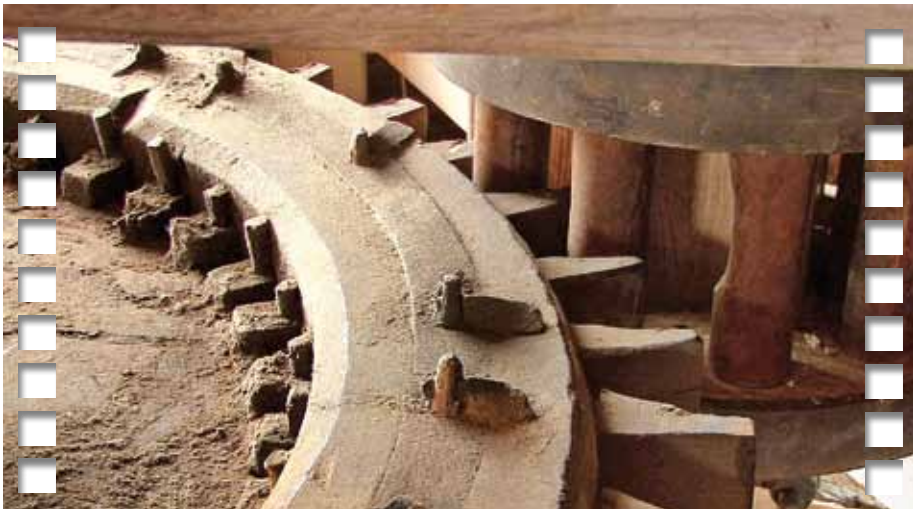
▲ Beeld uit de film: meervoudig vakwerk.

De door Bart Nieuwenhuijs uitgesproken vrees dat de nieuwe Huisman op windkracht niet al het binnenwerk kan trekken is in het licht van de tweedelige artikelenserie over de Hillegersbergse oliemolen van Heus bepaald niet illusoir (2011-7; 2012-3). Ook de snuifmolen De Lelie in Kralingen werd om dezelfde reden verhoogd. Trouwens: op laatstgenoemde molen en/of zijn buurmolen De