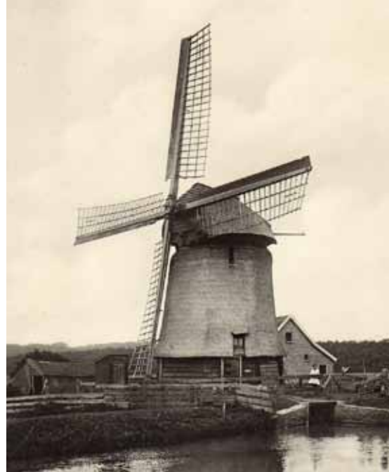
▲ De Damlander molen in Bergen omstreeks 1930. De situatie van de molen is op dit moment wel heel anders.

- Het was de bedoeling dat de verplaatste en gecompleteerde korenmolens van 't Zand dit jaar met Nationale Molendag in bedrijf zou worden gesteld. Door vertraging in de bouw en bij de verdere afwerking rondom de molen blijkt dit helaas niet haalbaar. De nieuwe