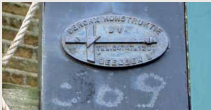
Binnen roede, gelast. 20.70 meter. Bouwjaar na 1945.

▲ Fabricageplaatje van Potroe no. 1539 uit 1888 in de molen van Rockanje. Deze houdt het dus aanmerkelijk langer uit dan zijn confrater uit 1944 (foto Ad Boutkam, 15 april 2009).