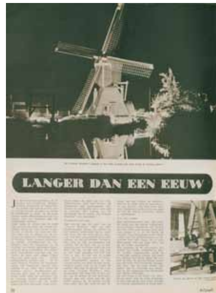
▲Een pagina van het Spiegel-artikel van 26 september 1953 ter gelegenheid van de voltooiing van de restauratie van de molen.

Ik hoop met bovenstaande te hebben duidelijk gemaakt dat de schrijfwijzen van de naam De Trouwe Wa(g)(c)hter