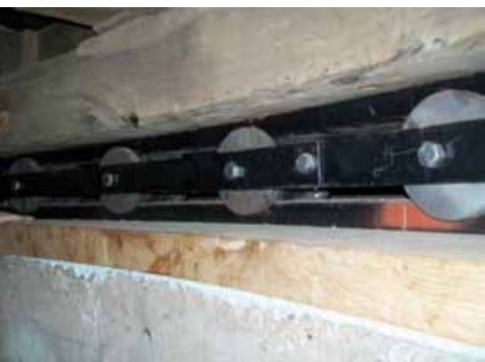
▲ Het nieuwe Engels kruierwerk in de Aeolus in Vlaardingen (5 april 2012).