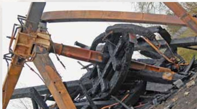
▲ De as, de roeden met het bovenwiel en de vang (foto H. Noot, 12 april 2012).