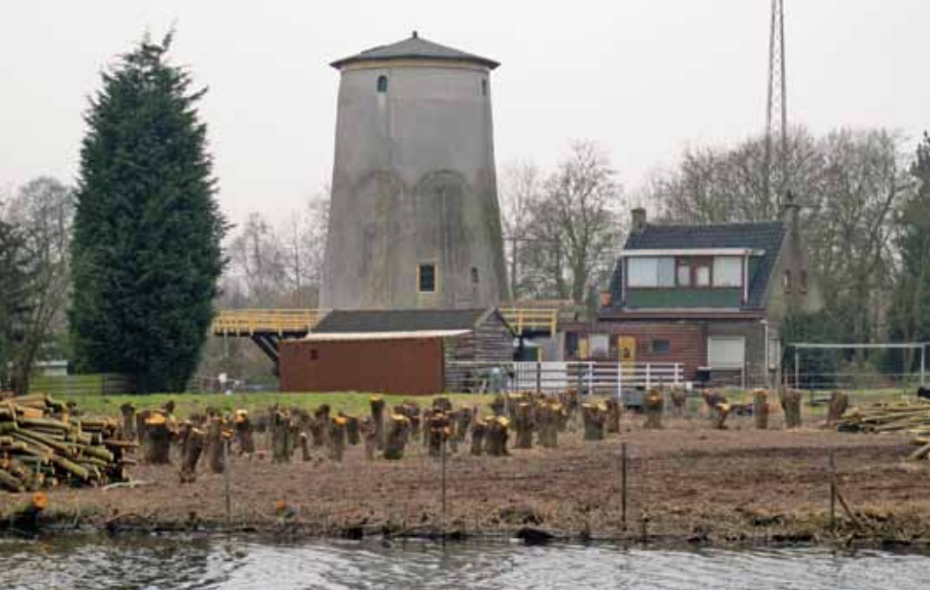
▲De Babbersmolen in Kethel, gezien vanaf de Poldervaart over het vlietland met het machinistenhuis (foto E.G.M. Esselink, 3 maart 2012).