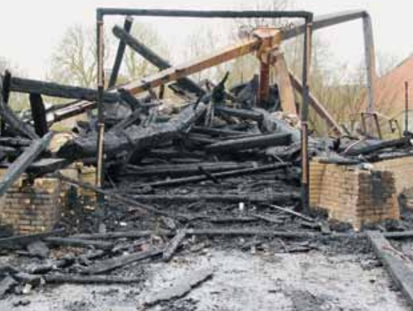
▲ Uitgemalen (foto H. Noot, 12 april 2012).