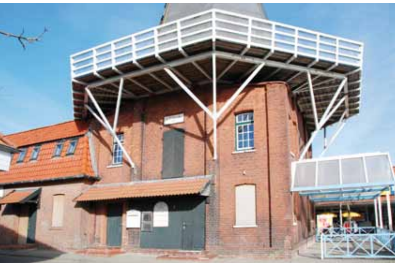
▲De vierkante onderbouw van de molen en boven de deur een stichtingssteen met 'V.J. Scheepker 1894'. Al zou men het niet direct zeggen: de constructie van de balie is van ijzer, waarbij de buitensluiting een I-profiel is (foto H. Noot, 9 februari 2008).