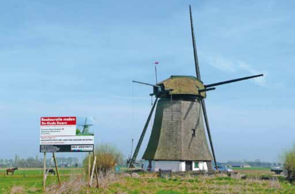
▲ De molen van de voormalige Oude Doornpolder bij het begin van de restauratie (foto Gerard Barendse, 27 maart 2012).

Het is goed voor de economie en de voor verlaging van het financieringstekort als de overheid meer uitgeeft aan het onderhoud van monumenten. Van iedere euro die de overheid daaraan