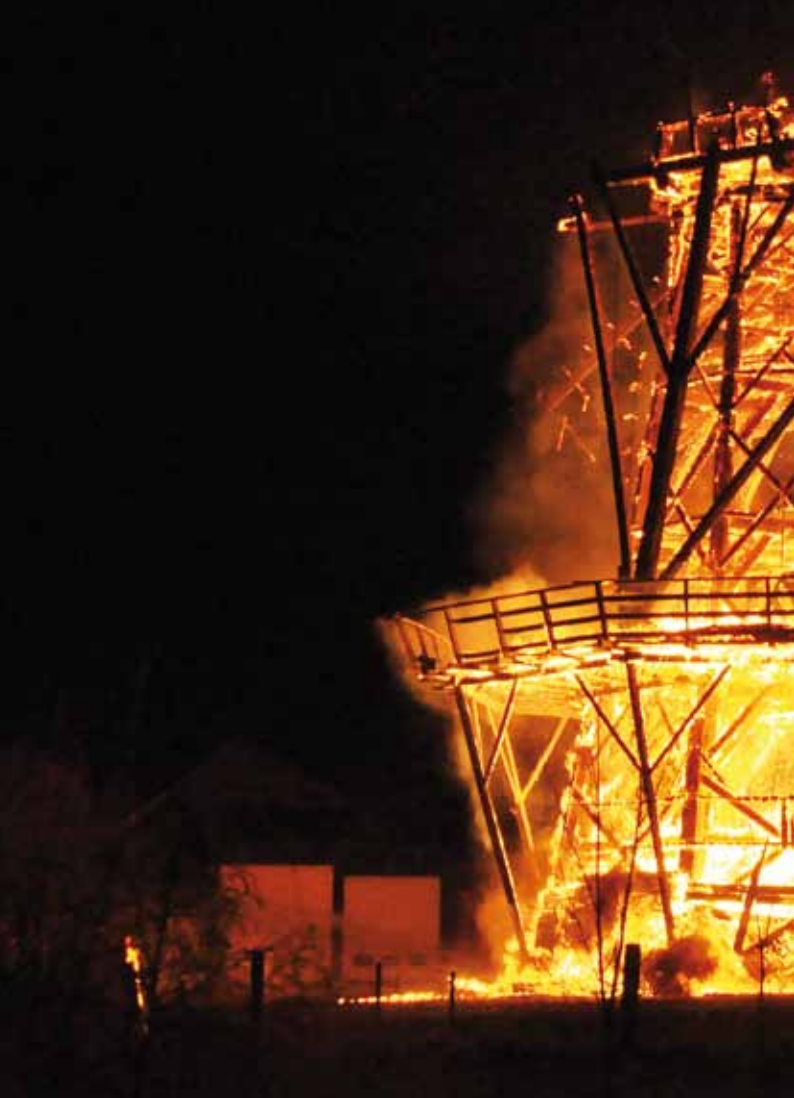
▲ De molen in een kansloze eindstrijd (8 april 2012, 22.56 uur).

De brandweer van Grijpskerk werd even voor elfen gealarmeerd maar kon voor de molen niets meer uitrusten. Daarom verlegde men de prioriteit gelegd op het beschermen van de omliggende panden. Ook het korps van Zoutkamp werd opgeroepen voor assistentie. Er moest een beroep worden gedaan op korpsen uit Groningen omdat de brandweer van onder andere Dokkum al was uitgerukt naar een brand in Gerkesklooster. De dichtstbijzijnde hoogwerker stond op dat moment zelfs in de stad Groningen. De Windlust was niet meer te redden en de brandende molen stortte binnen een half uur, even na elfen, in een baaiert van vlammen ineen. Door de hitte van het vuur zijn ramen van een naastgelegen kerk gebarsten. Ook een camper en een bestelauto die vlak bij de molen geparkeerd stonden, raakten beschadigd. De eeuwenoude molen moet als verloren worden beschouwd.