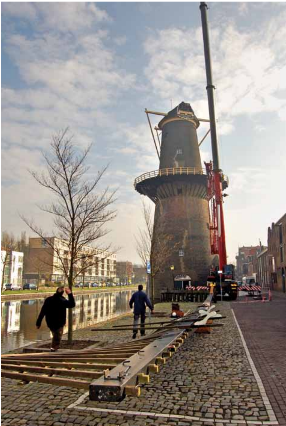
▲ Schiedamse reus tijdelijk wickenloos (12 april 2012).

per om ze er helemaal af te halen. De werkzaamheden vinden plaats in een nabijgelegen bedrijfspand dat groot genoeg is om de roeden te bergen. Naar verwachting zal het herstel begin mei zijn afgerond, en kan De Vrijheid op Nationale Molendag op 12 mei weer volop draaien. Stichting De Schiedamse Molens.