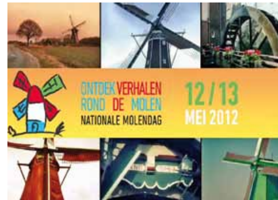
▲ Thema: Ontdek verhalen rond de molen, voor de veertigste Nationale Molendag op 12 en 13 mei.

Op zaterdag 12 en zondag 13 mei is het weer Nationale Molendag. Dit jaar met een extra feestelijk tintje. Het is namelijk voor de veertigste keer dat dit unieke molenevenement wordt gehouden. Jong en oud kunnen op deze twee dagen weer volop genieten van dit oer-Hollandse monument. Overal in het land zetten molenaars de molendeur en open voor bezoek. Velen van hen organiseren allerlei activiteiten in en rond de molen, variërend van brood bakken en exposities tot markten en wandel- en fietstochten. Ook voor kinderen worden allerlei activiteiten georganiseerd. Ieder jaar organiseert De Hollandsche Molen in samenwerking met Het Gilde van Vrijwillige Molenaars dit landelijke molenevenement. Dit jaar staat de Nationale Molendag in het teken van verhalen op en rond de molen. Het publiek is uitgenodigd om bijzondere verhalen, gedichten en legendes over het leven op en rond de molens te ontdekken. De aandacht voor molenverhalen sluit aan op het Jaar van het Immaterieel Erfgoed. Molens zijn volgens De Hollandsche