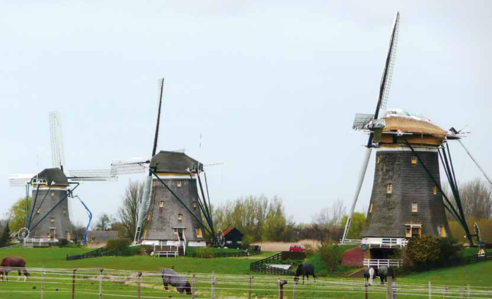
▲De rietdekkers aan het werk op de kap van de ondermolen van de Driemanspolder in Leidschendam en de molenmakers aan de bovenmolen (foto Gerard Barendse, 10 april 2012).