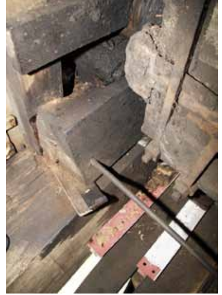
▲ De halssteen van de Fehsenfeldsche Mühle puilt naar buiten (foto Carsten Lucht, 29 oktober 2011).