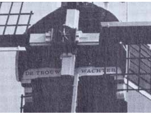
▲De molennaam in een moderne drukletter op de windpeluw. De haan op de makelaar, symbool van de waakzaamheid, werd na de restauratie van 1953 aangebracht. Meestal treft men die op een ander soort gebouwen aan. Bij de plaatselijke dorpskorenmolens De Oud Strijder, eveneens een wipmolen, stond de naam ook op de windpeluw.

uit 1991 hanteren beiden de spelling met 'GH'. Ook de Nederlandse Molendatabase en de Molendatabase van De Hollandsche Molen hanteren of hanterden tot kort geleden de spelling met 'GH', waarschijnlijk overgenomen uit het laatste provinciale molenboek. Naar