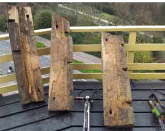
▲ De aangevretten bosstukken van de as in de Aeolus in Vlaardingen (foto W. Herrewijnen, 9 april 2012).

Haringvliet hebben we de binnenroede vernieuwd, hier verdween weer een Bremerroede welke in de jaren '70 regelmatig werden gestoken op Goeree-Overflakkee. Nu is er een Straathofroe gestoken.