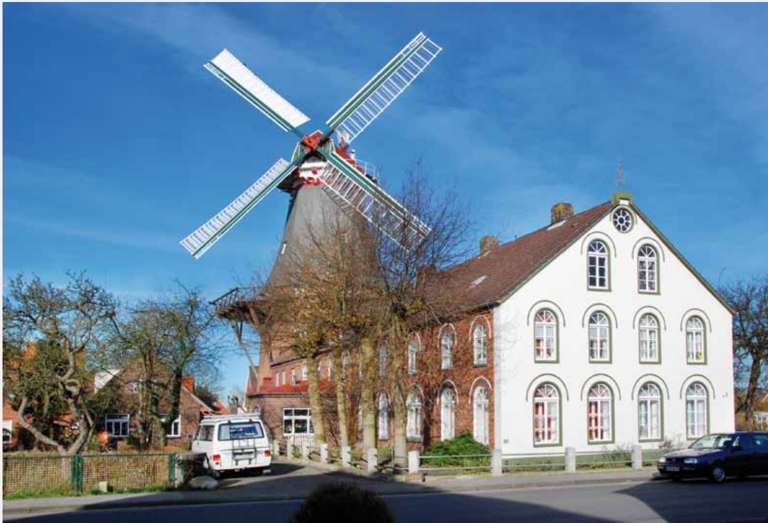
▲De Westgaster Mühle is een indrukwekkend geheel (foto H. Noot, 9 februari 2008).