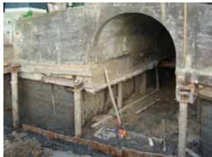
▲ Het verdiepen van de achterwaterloop voor de Kockengense molen in de beginfase. Het is wel duidelijk dat de tasting bepaald niet optimaal meer was (foto Verbij Hoogmade, 5 oktober 2011).

Na het plaatsen van de kap etc., zijn staart en schoren afgemaakt en de roeden opgehekt. Het schilderwerk is voltooid zodat de molen uitwendig klaar is. Binnen is het spoorwiel gerestaureerd, de vang aangebracht en momenteel wordt gewerkt aan het opstellen van de maalstenen.