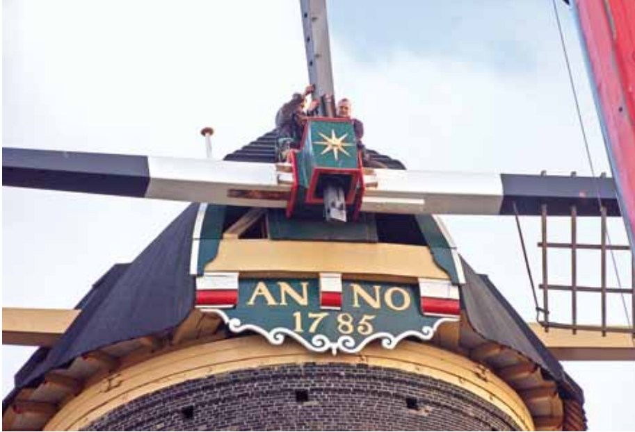
▲ De buitenroe gaat de askop uit (foto P. Sporken, 11 april 2012).