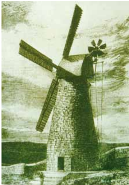
▲De molen van Montefiore in Jeruzalem, afgebeeld in 1858 in Illustrated London News .

Op 24 maart konden media en bezoekers in het Friese Sloten kennis nemen van de restauratiewerkzaamheden voor de molen van Montefiore in Jeruzalem, een uit 1856 stammende molen in het Midden-Oosten. Die dag waren onder andere de gloednieuwe molenkap, de nieuwe gegoten en gedraaide as en het buigen van het hout voor de kasspannen te bezichtigen, te fotograferen en te filmen. In 2007 nam de in Nijkerk gevestigde Stichting Christenen voor Israël het initiatief tot de restauratie van de molen. Deze was anderhalve eeuw eerder aan de stad Jeruzalem geschonken door de Engelse filantroop Moses Montefiore en bedoeld om arme Joden op goed-