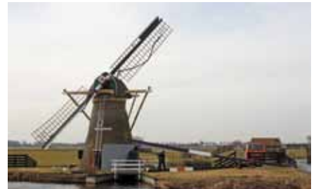
▲ Het steken van een nieuwe roede in De Hoop doet Leven bij Voorhout (22 februari 2012).