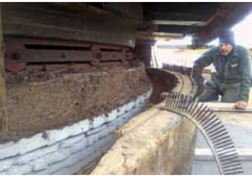
▲ Het vernieuwen van de kuip bij de molen in 's-Gravenpolder. De ijzeren 'borstels' op het kuipstuk moeten vogels de toegang tot de molenkap en daarmee de vervuiling verhinderen. Aan de takjes naast de rail van het Engels kruiwerk te zien werkt het toch niet volledig (foto Poland, 30 maart 2012).