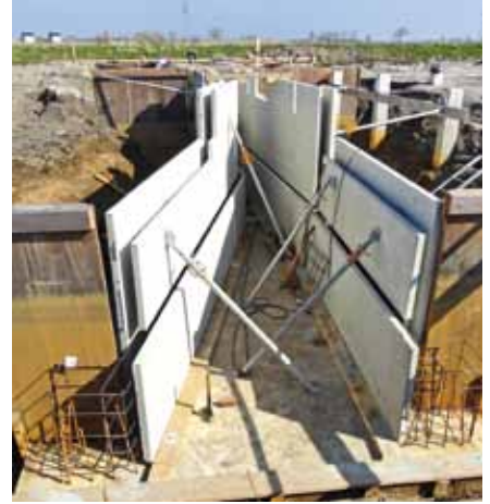
▲ De nieuwe fundering voor de Munnikenmolen bij Leiderdorp in aanbouw (foto Verbij Hoogmade, 22 maart 2011).