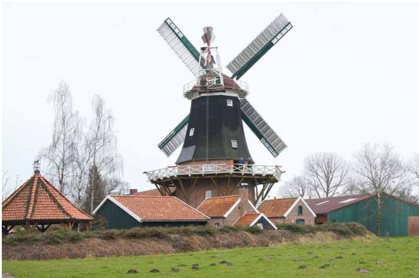
▲ De weer opgebouwde molen van Rhaude, tientallen jaren een stomp.

De Fehsenfeldsche Mühle in Marfeld, een mooie grote Oostfriesse molen is sinds een jaar tot stilstand gedwongen; vooral veroorzaakt door een verrot windpeluw; haast vanzelfsprekend op