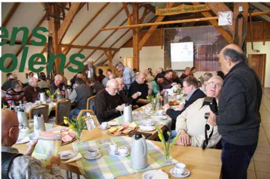
▲ De bijeenkomst van de Nedersaksische vrijwillige molenaars (foto Carsten Lucht, 17 maart 2012).

Op zaterdag 17 maart kwam de Werkgroep Freiwillige Müller und Müllerinnen in de Mühlenvereinigung Niedersachsen - Bremen e.V. voor de dertiende keer bijeen, nu in Ostrhauderfehn, waar een inleiding over het molenonderhoud werd verzorgd door Monumentendienst; Info- und Wartungsdienst für historische Gebäude uit Cloppenburg. Natuurlijk stonden de molens daarbij in het brandpunt. Verder werden er nog enige mo-