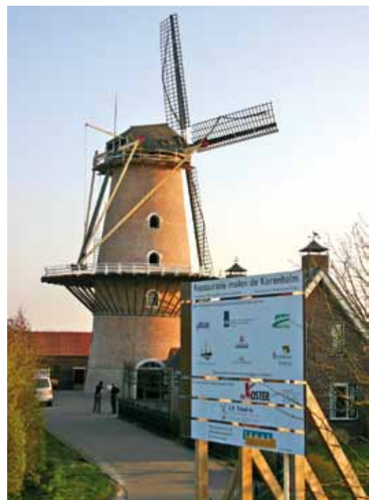
▲ De Korenbloem in 's-Gravenpolder tijdens de werkzaamheden.