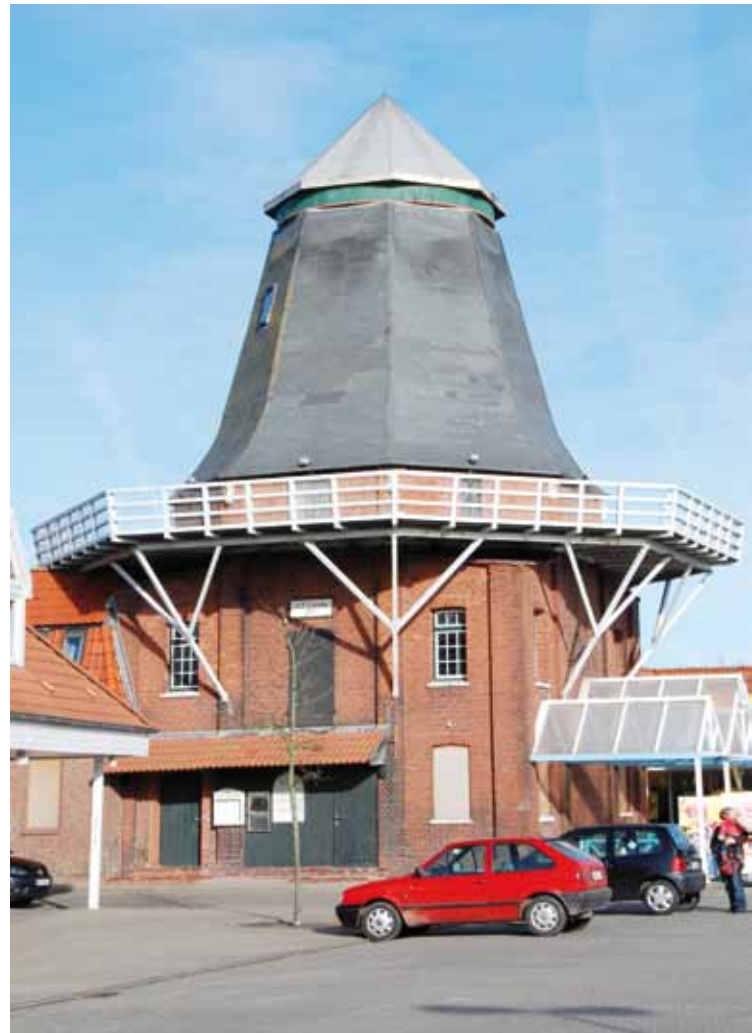
▲De gemolen gefotografeerd van vrijwel hetzelfde punt als de foto van een halve eeuw geleden (foto H. Noot, 9 februari 2008).

De Silbermühle doe zijn zilveren bedekking en meer heeft verloren is een blikvanger in het winkelcentrum die om meer vraagt (foto H. Noot, 9 februari 2008).▼