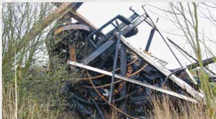
▲ Wat eens een mooie molen was in het Friese landschap (12 april 2012).