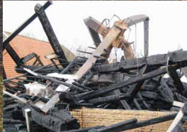
▲ De as en de geplooidde roeden staan nog als een soort reuzeninsect overeind (12 april 2012).