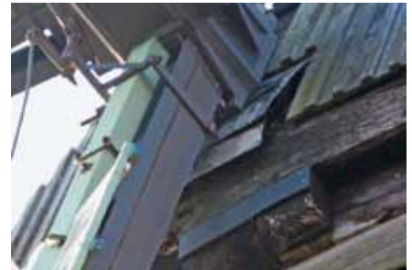
▲ In de kap: om ongelukken te voorkomen is de as onderstept (foto Carsten Lucht, 29 oktober 2011).