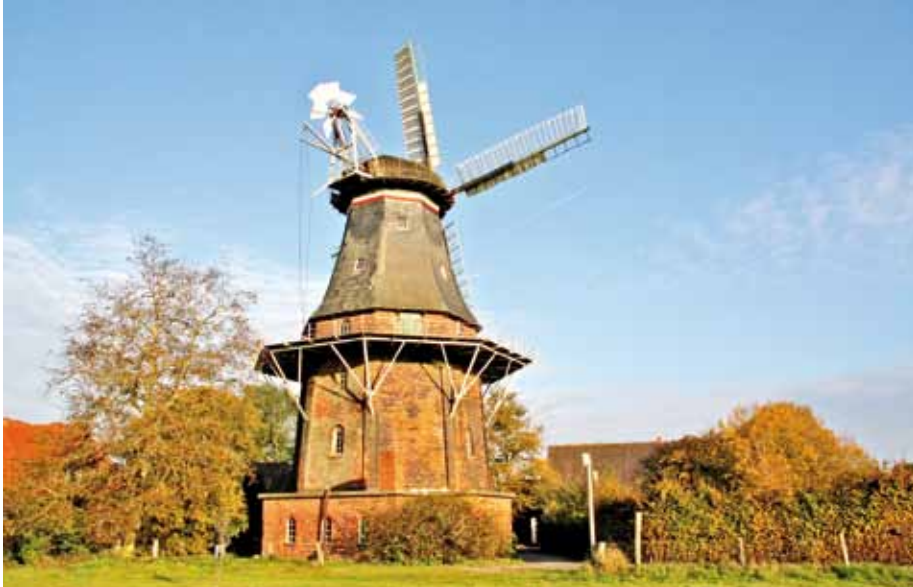
▲ Fehsenfeldsche Mühle in Martfeld met aangebouwde machinekamer. De uitlaat met knalpot wijst de functie uit (foto Carsten Lucht, 29 oktober 2011).

de vereiste pecunia, maar Gräpel is vol goede moed en hoopt dat nog dit jaar het euvel verholpen kan worden. Er staan nog meer reparaties op het programma die de vereniging gedeeltelijk in eigen beheer wil uitvoeren. Een andere wens is het weer in orde maken van de oude dieselmotor die nog in de molen staat.