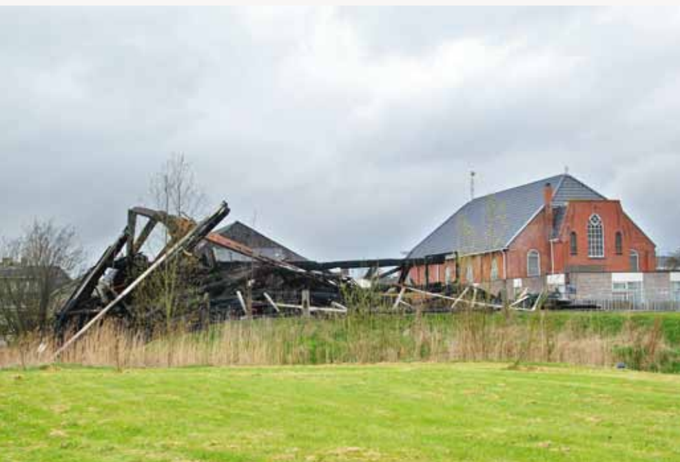
▲Ooit een molen! Weer een molen? (foto H. Noot, 12 april 2012).

werden er nog twee jongens van 12 en 14 jaar oud aangehouden die ook met vuurwerk in de weer zouden zijn geweest en in de buurt van de molen vuurwerk