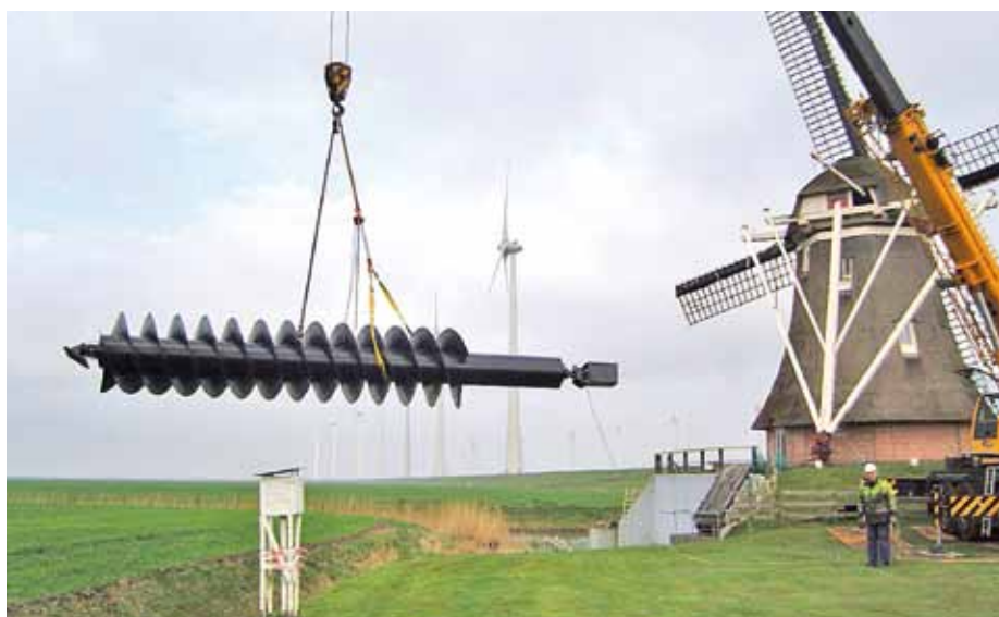
▲ De nieuwe vijzel voor De Goliath (foto: I. Wierenga, 11 april 2012).

streefdatum voor de opening is vrijdag 3 mei 2013.