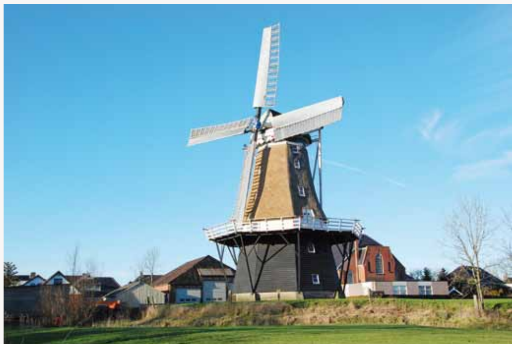
▲ De molen met nieuw rietdek (10 februari 2008).

Aangezien er jongens waren gesignaleerd die met vuurpijlen in de weer waren en er resten van vuurpijlen in de omgeving van de molen waren gevonden ging de politie er vanuit dat er een vuurpijl in het rietdek van de molen was te-