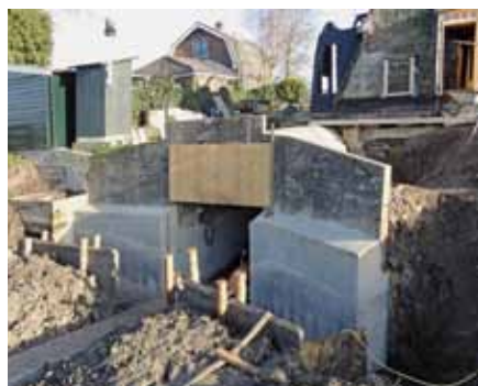
▲ De verdiepte waterloop van de Kockengense molen. Het scheprad zal aanzienlijk dieper in het water steken zodat de molen weer daadwerkelijk kan functioneren voor de bemaling (foto Verbij Hoogmade, 30 november 2011).